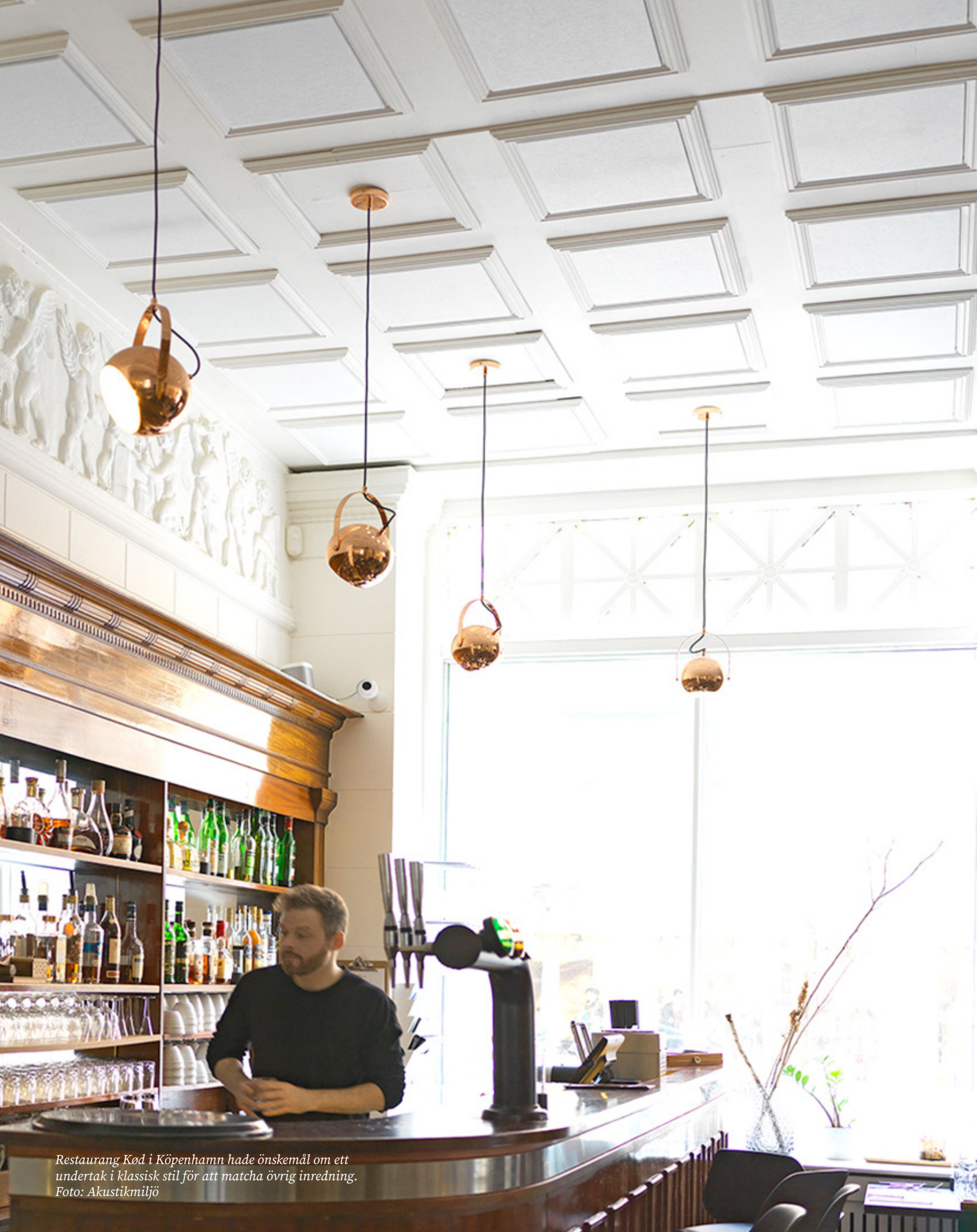
Restaurang Kød i Köpenhamn hade önskemål om ett undertak i klassisk stil för att matcha övrig inredning.