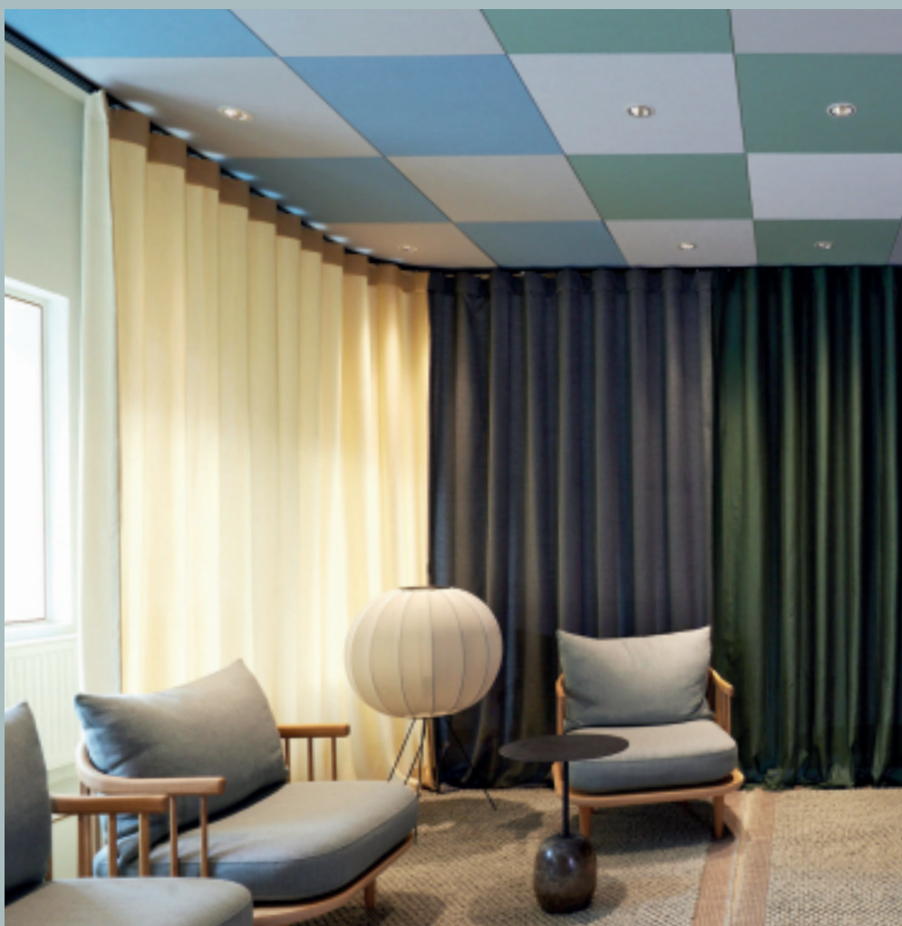
Danmarks första kontor som uppnår WELL – Certified™ Platina, Rockfon HK