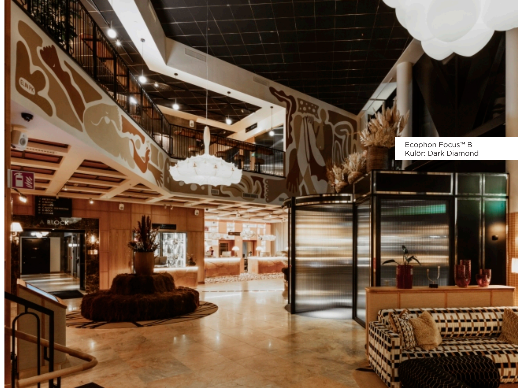
Ecophon Focus™ B Kulör: Dark Diamond

Jacy'z erbjuder restauranger, barer och aktiviteter, alla med sin egen unika look och känsla. Ecophon Focus™ har spelat en viktig roll i arbetet med att integrera taken i lokalernas olika stilkoncept och samtidigt säkerställa god akustik.